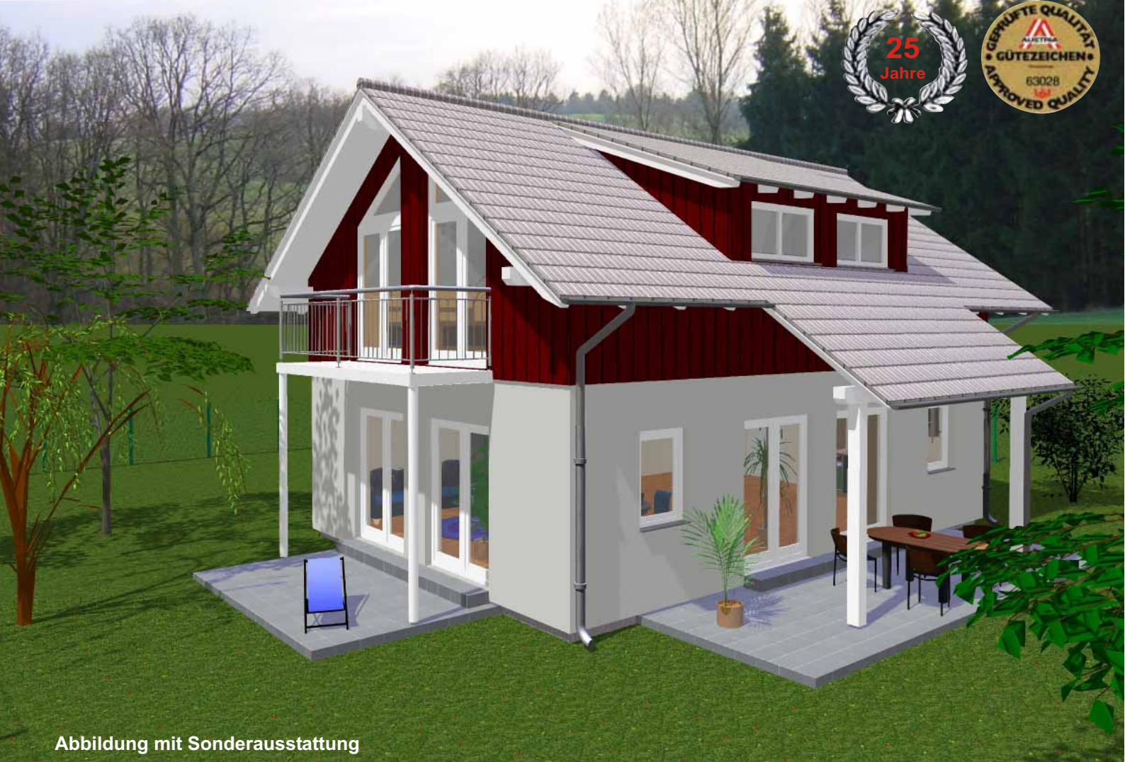
Abbildung mit Sonderausstattung