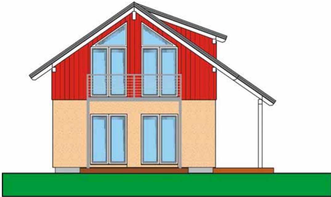
Abbildung mit Sonderausstattung