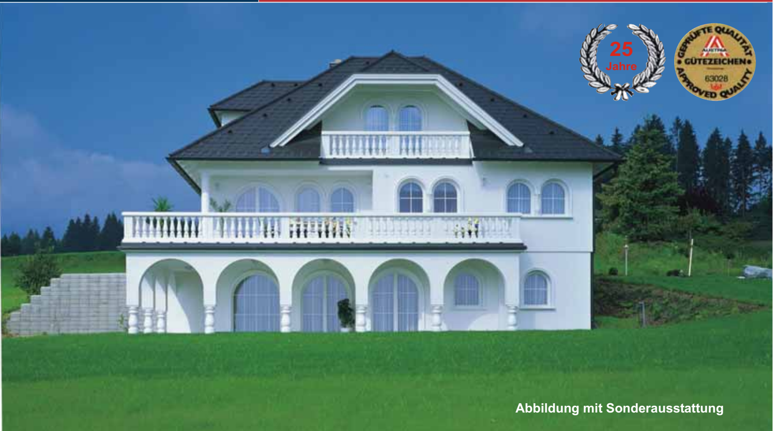
Abbildung mit Sonderausstattung