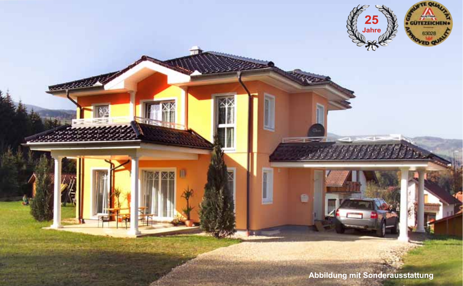
Abbildung mit Sonderausstattung