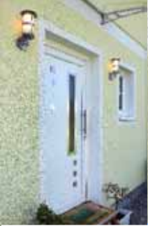
Abbildung mit Sonderausstattung